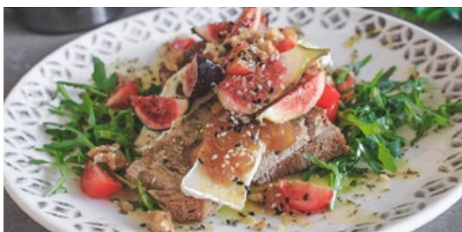
Bruschetta Brie, Figues et Noix