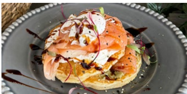
Pancakes Saumon Fumé