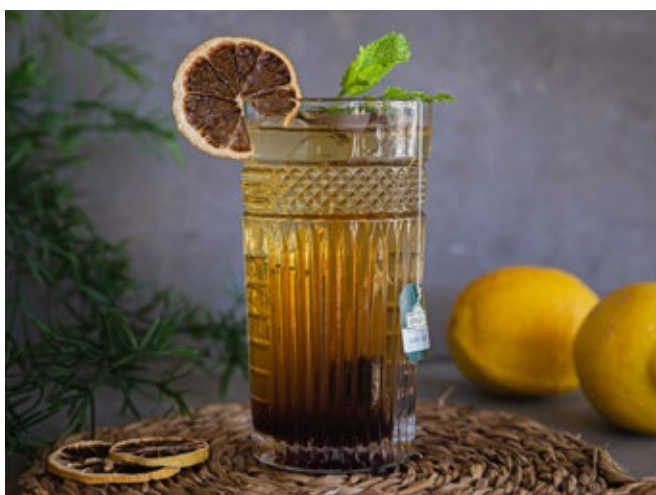
Ice Tea à Esquina