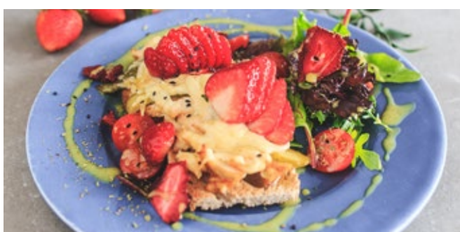
Bruschetta Gratinée au Poulet