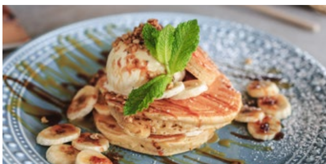
Pancakes Caramel Salé