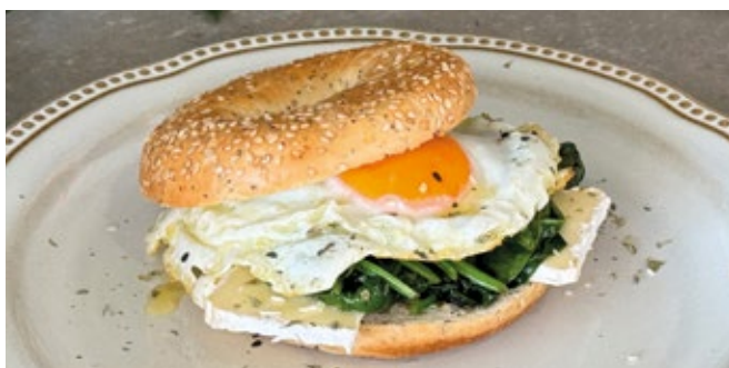
Bagel Brie et Oeuf