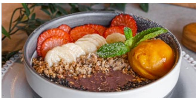
Bol de Smoothie Açaí