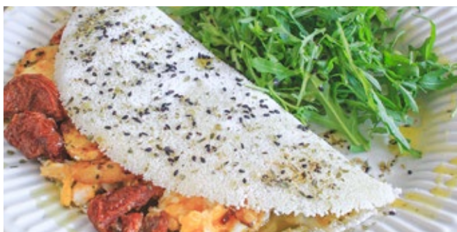
Tapioca à Esquina