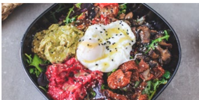
Bol de Salade Végétarienne