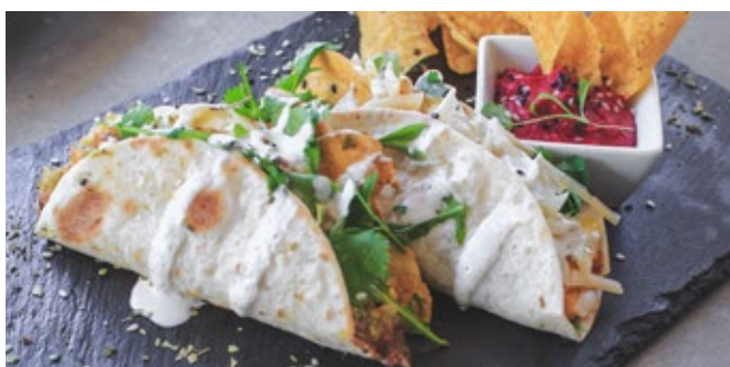
Tacos à Esquina