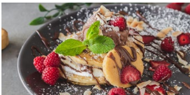
Pancakes Noix de Coco, Chocolat et Framboises