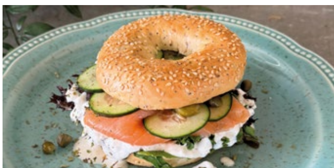
Bagel Saumon Fumé