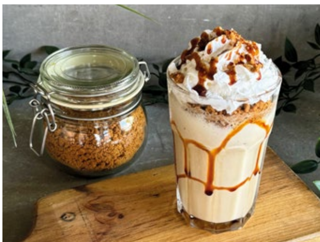
Frappé Caramel Salé