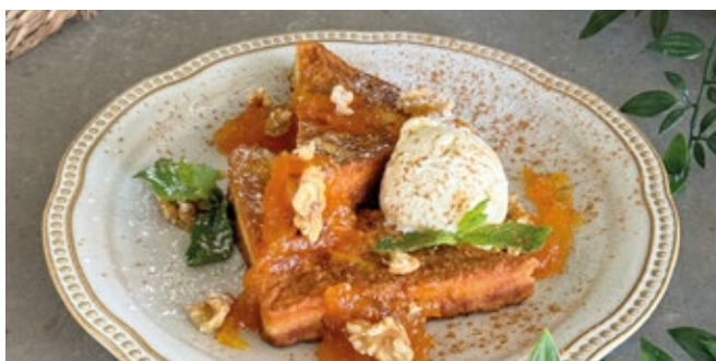
Pain Perdu Citrouille et Noix