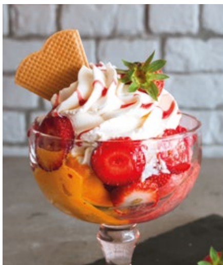
TAÇA MORANGO - 11,00€

Chocolate, Baunilha de Bourbon, Doce do Algarve e Chantilly