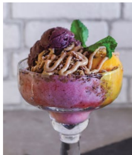
TAÇA AÇAÍ - 11,00€

Chocolate, Baunilha de Bourbon, Stracciatella e Chantilly