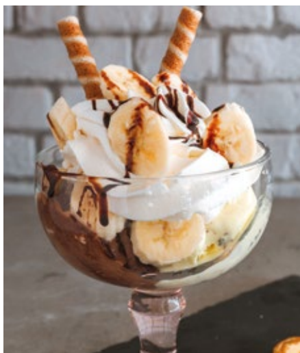
TAÇA BANANA CHOC - 11,00€

Chocolate, Baunilha de Bourbon, Kinder Bueno e Chantilly