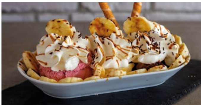
BANANA SPLIT - 12,00€

Açaí, Sorvet de Manga, Sorvet de Morango, Manteiga de Amendoim e Granola Caseira