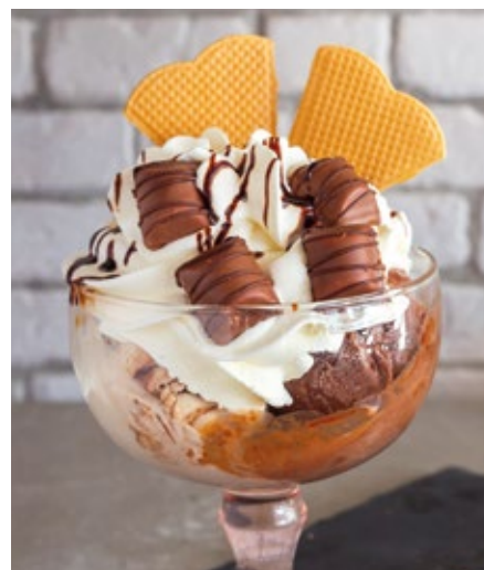
TAÇA KINDER BUENO - 11,00€

Baunilha de Bourbon, Morango, Sorvet de Frutas e Chantilly