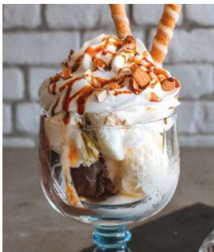
TAÇA ALGARVE - 11,00€

Chocolate, Baunilha de Bourbon, Doce do Algarve e Chantilly