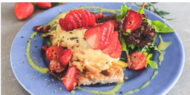
Bruschetta Gratinada de Frango