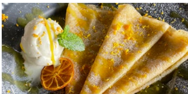
Crepe Laranja Caramelizada