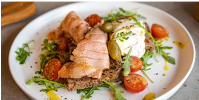
Bruschetta Salmão Fumado Braseado