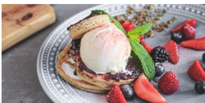
Panquecas à Esquina