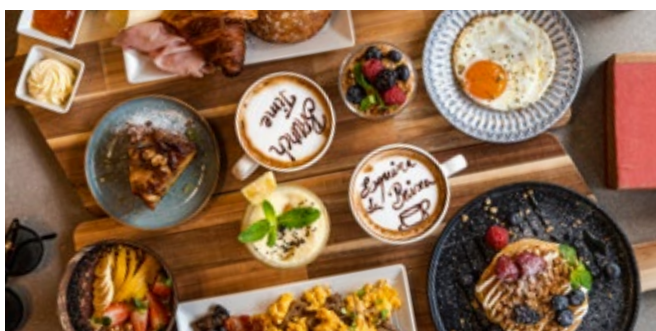
Menu Alvorada e Menu Nã Vás Com Fome