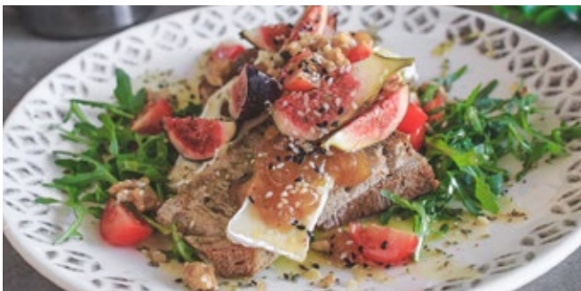
Bruschetta Brie, Figo e Nozes