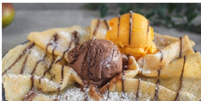
Crepe 2 Bolas de Gelado e Topping