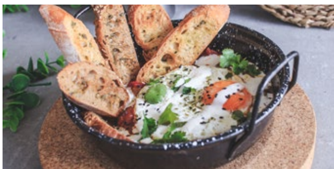
Shakshuka à Esquina