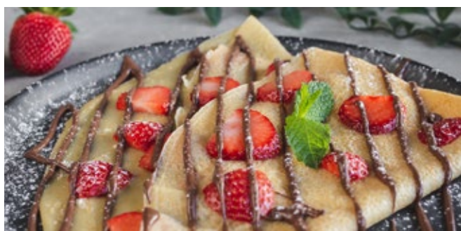
Crepe Morangos e Topping