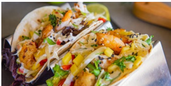
Tacos de Camarão