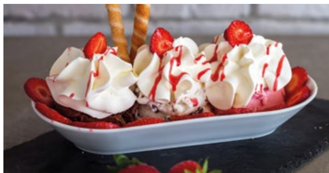
MORANGO SPLIT - 12,00€

Banana, Gelado de Chocolate, Baunilha de Bourbon, Morango e Chantilly