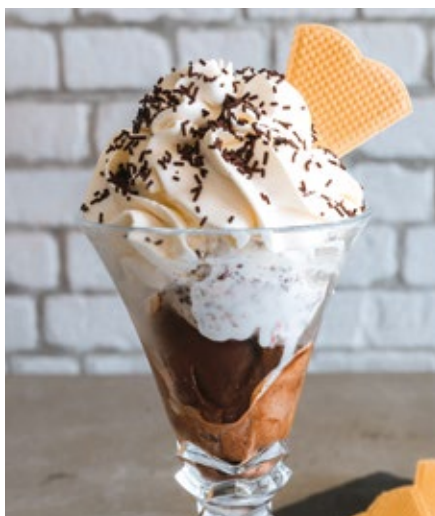
TAÇA STRACCIATELLA - 11,00€

Chocolate, Baunilha de Bourbon, Banana Choc e Chantilly